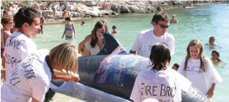
Demonstracija spašavanja nasukanog dupina, Dan dupina, 2006.

Spašavanje dupina neobično je težak i složen zadatak. Nažalost, rijetko je uspješan. Bilo kakav pokušaj spašavanja kita ili dupina trebale bi izvršiti iskusne osobe, posebno trenirane za takve situacije. Danas su u samo nekoliko država Europe prisutni biolozi i veterinari osposobljeni i s iskustvom za izvođenje ovog postupku. U Hrvatskoj nažalost nema osoba s adekvatnom izobrazbom za takvu proceduru.