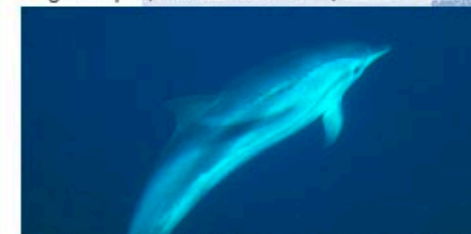
Prugasti dupin ( Stenella coeruleoalba )

Prugasti dupin je mali pučinski dupin rasprostranjen širom svijeta u umjereno toplim i tropskim morima. Najčešći je dupin Sredozemlja, a u Jadranu se vidi tek povremeno. Uz manji broj prirodnih neprijatelja, najveću prijetnju im predstavljaju ljudi. Tako se masovni pomor prugastih dupina u Sredozemlju početkom 90tih godina uzrokovan morbilni virusom povezuje sa smanjivanjem imuniteta uzrokovanog zagađenjem. Pretpostavlja se da je tada uginulo više tisuća prugastih dupina. Također, prugasti dupini često stradaju slučajno ulovljeni u pučinske mreže stajačice, a nestanak hrane zbog pretjeranog izlova ribe uzrokuje neuhranjenost i daljnje uganjanje.