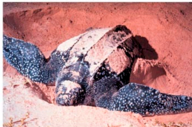
Sedmopruga usminjača ( Dermochelys coriacea )

Glavate želve mogu narasti preko 2 metra i težiti preko 200 kg. Zbog velike glave i jako snažnog kljuna su i dobile ime. Dok se hrane, rone otprilike 4 - 5 minuta, ali odmarajući se mogu provesti i nekoliko sati pod morem.