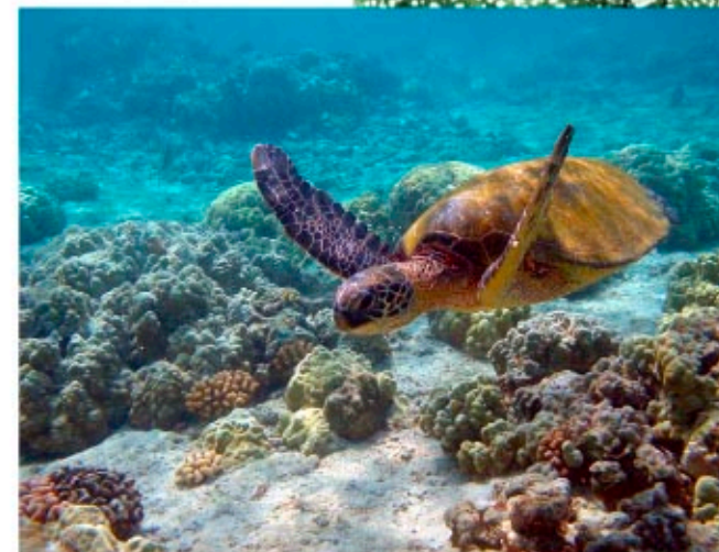
Zelena želva ( Chelonia mydas )

Za razliku od drugih morskih kornjača, zelene želve su biljojedi. Hrane se morskim travama i algama koje njihovom masnom tkivu daju blago zelenu nijansu pa su prema tome i nazvane zelene želve. Globalno su rasprostranjene u toplim morima, a u Jadranu se pojavljuju tek povremeno. Iako slične, razlikuju se od glavatih želvi po broju postraničnih keratinskih pločica na oklopu: glavate želve ih imaju 5, a zelene želve 4.